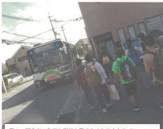
図1 西宮市の北部と南部を繋ぐさくらやまなみバス