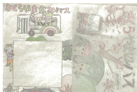
図4 実際に製品化されたクリアファイルのデザイン