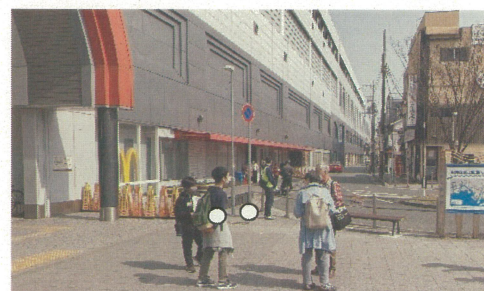
図5 グッズでさくらやまなみバスをPRする子供たちの様子