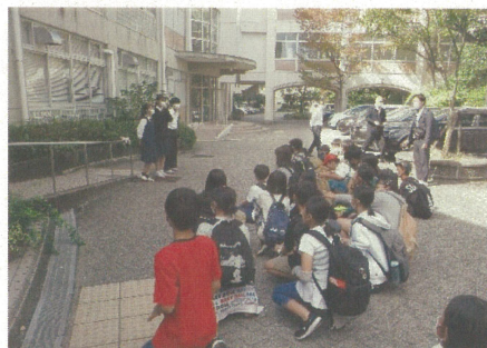
図3 西宮北高校でちらしを渡して伝える子供たち