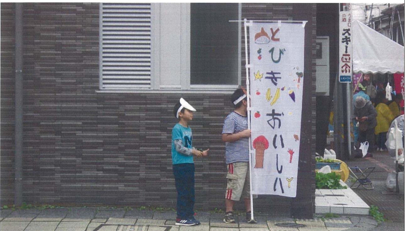
バス停の近くで「朝市感謝祭」をPRする『のぼりで朝市感謝祭をPRチーム』