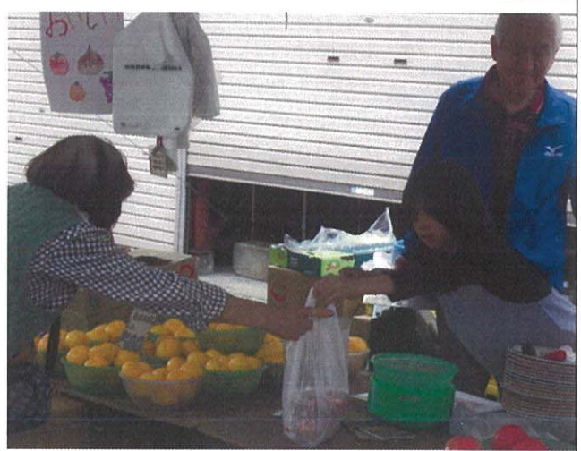
元気な接客で朝市を盛り上げたい『お店のお手伝いチーム』