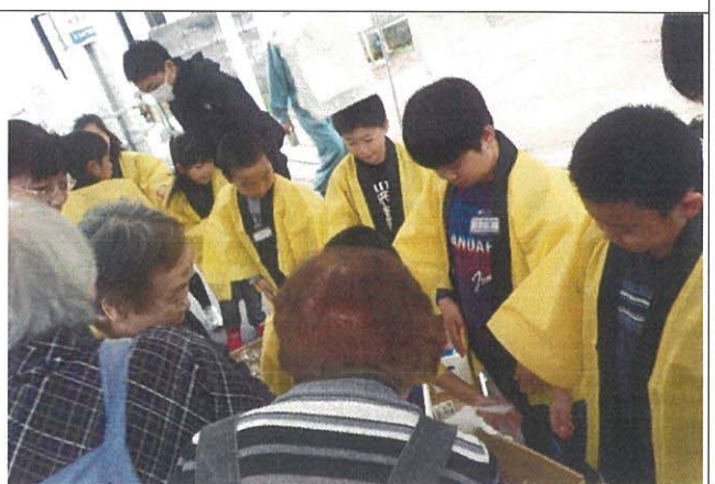
たまねぎ・じゃがいも・みかん・梨の完売を目指した『青果の特売チーム』