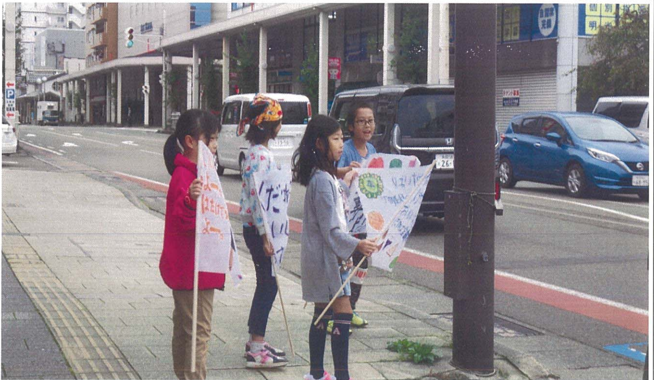
道行くドライバーさんに「朝市感謝祭」を宣伝する『朝市フラッグで宣伝チーム』